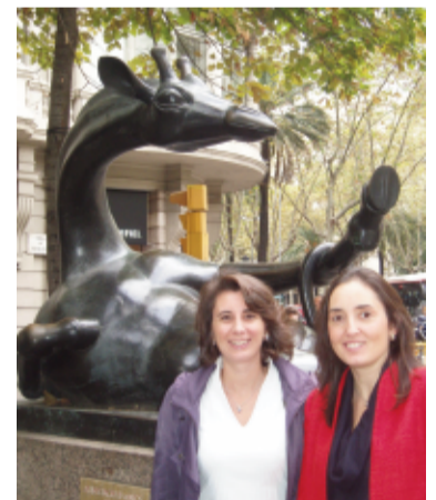
Escultura “La jirafa coqueta”, obra de Josep Granyer

Lo consiguen desde la confianza que aporta el hecho de ser, no sólo abogadas, sino conocedoras del mundo del Arte, de los artistas, de cómo funciona el sector y de su motivación por seguir aprendiendo y estar al día. También gracias a un gran trabajo de campo con el que han conseguido aglutinar conocimientos sobre una normativa muy diseminada, y con la ventaja que se deriva de toda especialización, es decir, la interrelación entre problemáticas ya trabajadas, lo que permite a Nial Advocats solucionar problemas en materia del Derecho del Arte de una manera más ágil, y acertada. Y eso sin perder la perspectiva generalista que – según consideran– todo abogado debe mantener en todos sus casos.